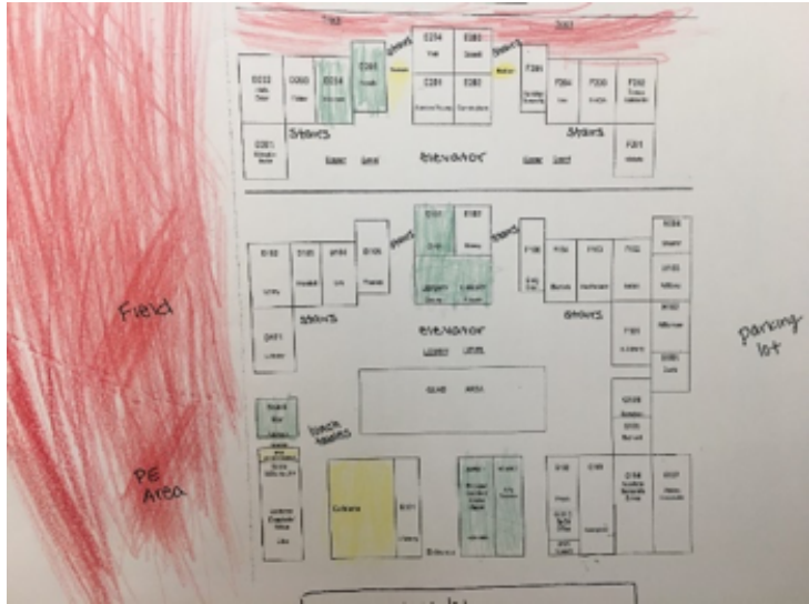
Los estudiantes señalan dónde se sienten seguros e inseguros en su ambiente escolar. Verde = seguro. Rojo = inseguro. Amarillo = algo inseguro.

También ha habido grandes éxitos en Sonora, donde los estudiantes querían ver más supervisión y atención del personal de servicio del patio. Esta solicitud resultó en un cambio en el comportamiento del personal de servicio del patio. Desde entonces, los estudiantes informaron que el personal de servicio del patio está más atento a lo que está sucediendo en el área de recreo, en lugar de simplemente conversar entre ellos. Otro éxito de Sonora ha sido la integración del personal del Centro de Crisis de Violación en el entorno escolar. El personal del Centro de Crisis de Violación ahora es visto como aliados adultos y desde entonces ha podido reforzar la importancia de los problemas sobre los que los estudiantes están aprendiendo. El personal del Centro de Crisis de Violación también ha podido construir sobre esta relación y facilitar programas para la escuela fuera de su alcance de trabajo de Los Límites Cambiantes. Por ejemplo, el director ha solicitado su experiencia en varios temas que van desde talleres sobre servicios informados sobre trauma para adultos hasta talleres de empatía y autoestima para estudiantes. CDPH, Safequest Solano y El Centro Para La Comunidad No Violenta (Center for Non Violent Community) esperan expandir el programa a más escuelas en el futuro y continuar apoyando la prevención del acoso sexual y los precursores de la violencia en el noviazgo a través de Los Límites Cambiantes.