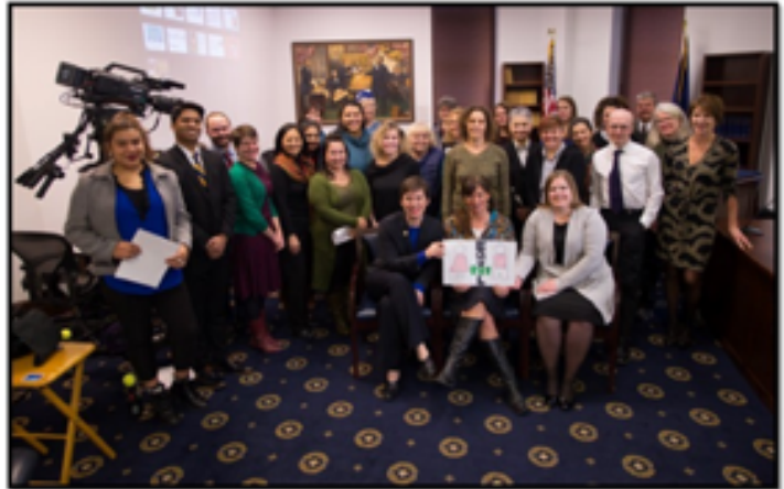
Un almuerzo legislativo que significa el noveno aniversario de la Ley de Pago Justo de Lilly Ledbetter.

YWCA está evitando intencionalmente la legislación o las rutas políticas como las principales soluciones al problema porque creen que el impacto será mayor al trabajar en las comunidades. En cambio, se centran en el papel que pueden desempeñar las empresas y organizaciones para crear un lugar de trabajo con equilibrio de género y fomentar la educación de las mujeres y las niñas sobre cuestiones relacionadas con la elección de carrera y la negociación salarial. YWCA ha podido identificar políticas y prácticas beneficiosas que promueven la equidad salarial de género y las comparte con otros. Por ejemplo, una acción que los empleadores pueden tomar es eliminar la información de identificación de los currículums vitae durante las prácticas de contratación u otra es volver a examinar las políticas de licencia de paternidad. YWCA también alienta el respaldo público del proyecto EconEquity, facilita foros comunitarios y ha creado una campaña de mercadeo social.